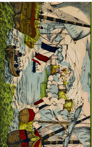
Prise du fort de Saint-Jean d'Uluda et de la Vera-Cruz par la marine française, 27 novembre 1838. Image d'Épinal, Imprimerie Pélern, vers 1880, détail