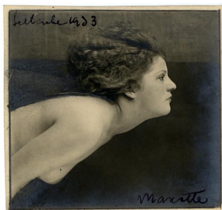
Italo Bertoglio – Velocità (1934)

15h30 : Visite de l'exposition « Italo Bertoglio et l'art moyen (1928-1935) »