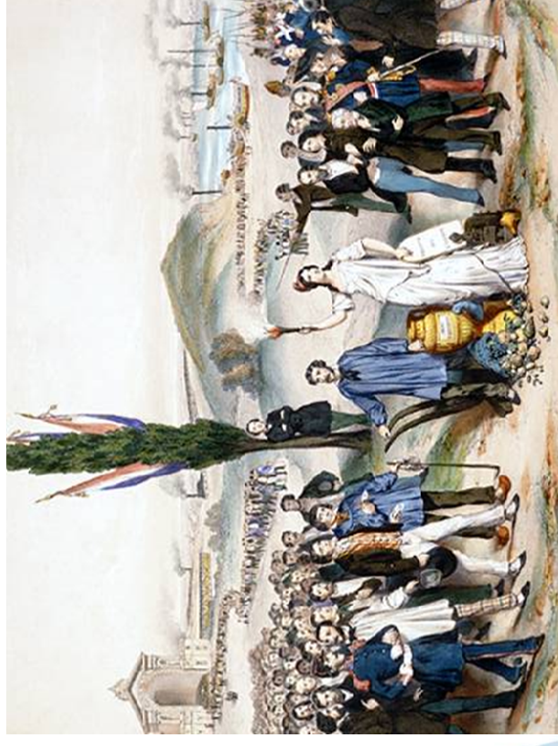
Frédéric Sorrieu, Suffrage universel dédié à Ledru-Rollin , 1850, lithographie, Musée Camavalet, Paris